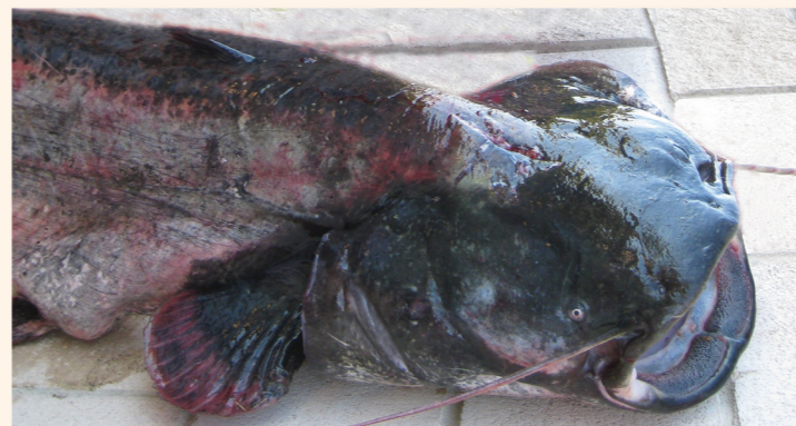
Silurio Embalse de Sobrón. Río Ebro.

Cangrejo Rojo y Señal: Con fines de erradicación y control se permite su posesión y transporte vivos para su posterior consumo.