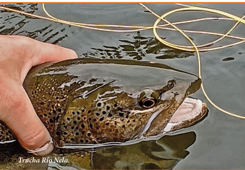
Trucha Río Nela.