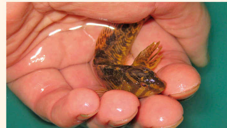
Pez Fraile, Joya del Nela.

Todos los días (en las aguas de acceso libre).