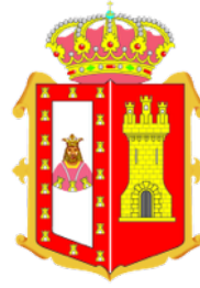
Diputación de Burgos