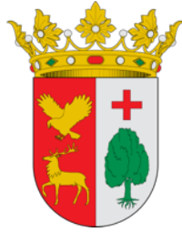
Ayuntamiento de Oña