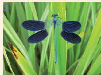
Caballito del Diablo. Río Nela.

Los días de la semana que aparecen resaltados en negrita son días de pesca «sin muerte», en los cuales todas las truchas comunes capturadas deben devolverse a las aguas.