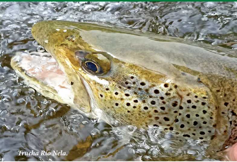
Trucha Río Nela.