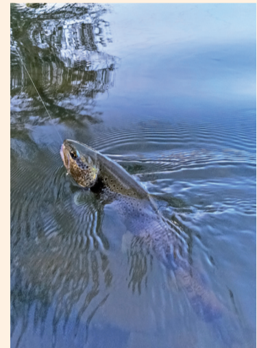
Trucha. Río Ebro