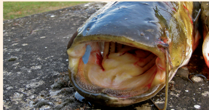
Silurio Embalse de Sobrón. Río Ebro.

Cangrejo Rojo y Señal: Con fines de erradicación y control se permite su posesión y transporte vivos para su posterior consumo.