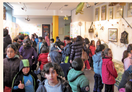
Jornada pesca. Infantil.