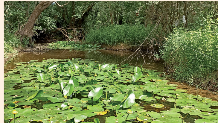
Nenúfares. Río Nela.

Todos los días (en las aguas de acceso libre).