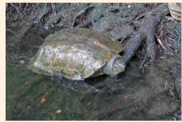
Galápago sarnoso. Río Nela.

Los días de la semana que aparecen resaltados en negrita son días de pesca «sin muerte», en los cuales todas las truchas comunes capturadas deben devolverse a las aguas.