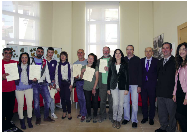
Los alumnos del curso recogieron su diploma

Hace unos días los alumnos del curso participaron en la organización de la jornada del día del árbol junto a los niños del colegio público, recogiendo esquejes de lavanda que después ayudaron a plantar junto a tulipanes y varios árboles.