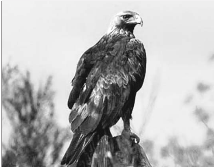
► Águila Real

El periodo de celo que comenzará pronto, Diciembre-Enero, se caracteriza por unos vuelos realizados con ondulaciones muy largas seguidas de picados cerrando las alas para volver a abrirlas y ascender bruscamente haciendo una suerte de "looping" que resulta realmente sobrecogedor y es una de las mas bellas imágenes que se pueden ver en la naturaleza. Estos vuelos los realizan especialmente en las cercanías de sus territorios que defienden frente a otras águilas. Los acoplamientos o cópulas se realizan sobre todo en Marzo, y previamente, las águilas han acomodado alguno de los diferentes nidos que poseen en su territorio, a menudo tienen entre tres y cinco emplazamientos donde han tenido nido estas o sus predecesoras en el territorio.