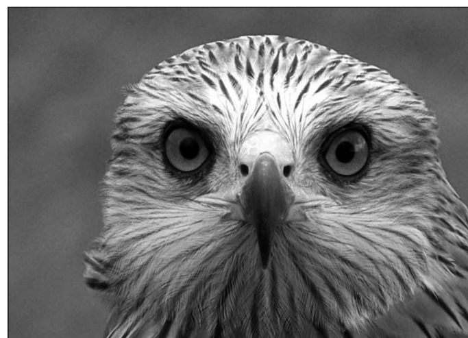
► Milano Real

Ambas rapaces son especies protegidas, cuyas poblaciones no se encuentran amenazadas en nuestra comarca, aunque si empiezan a escasear en otros lugares de Europa como Francia. En Las Merindades, la abundancia de comida fácil por los basureros y muladares de granjas de pollo ha influido favorablemente en sus poblaciones. También se ha detectado en alguna ocasión algún milano hallado muerto por envenenamiento.