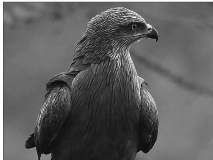
► Milano Negro

En nuestra provincia, las dos especies de milano que viven en la Península Ibérica alternan su presencia en las dos épocas del año. Con el frío un buen número de