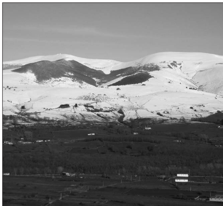
■ Picon blanco desde Bedón