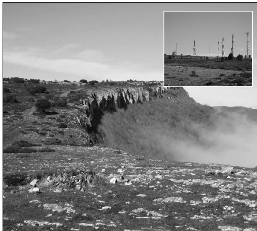
■ Vista desde arriba

■ A pesar de la discreta cumbre, la vista desde arriba es una de las mejores de la zona norte de las merindades y la panorámica, sobre todo hacia el norte es verdaderamente espectacular.