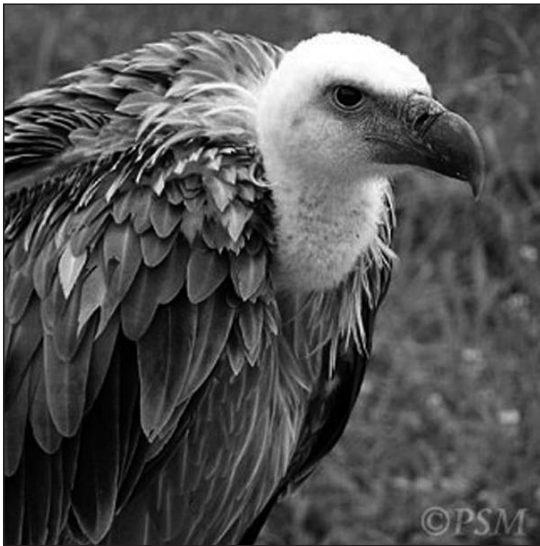
► Buitre Leonado

Los que han visto los documentales de F. Rodríguez de la Fuente recordarán sin duda el capítulo del experimento de romper huevos de avestruz con piedras, por parte de un ejemplar, criado totalmente en la Península (el alimoche llamado Gaspar), que lo hizo nombrarlo como "el buitre sabio". Demostrando así, que era un comportamiento innato de la especie, no aprendido por imitación, ya que Gaspar nunca estuvo en África y no había visto un huevo de avestruz en su vida, y utilizó piedras con el pico para romperlo como hacen los adultos allí.