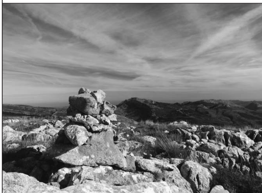
■ Hito sobre la cima