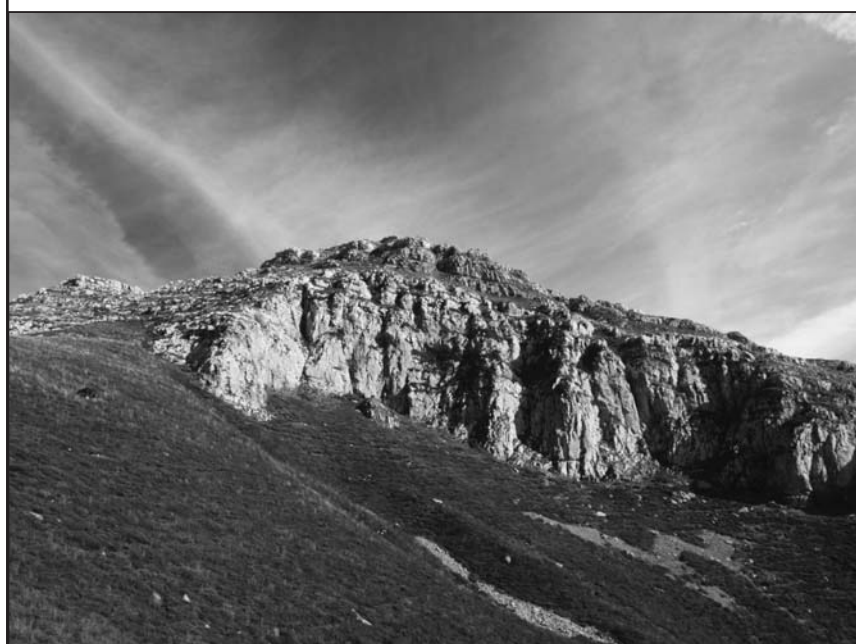
■ Peña Becerril

■ Tras bordear una dolina grande subimos por terreno sucio a la Porra de Peña Becerril con 1450m. Marcado con un hito de piedras con una gran panorámica.