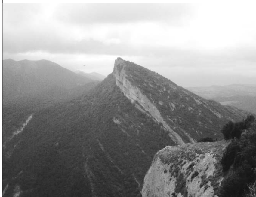
■ pico del pino y pico de los buitres.