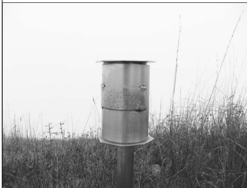
■ Buzón del Vienda a 1.070 metros