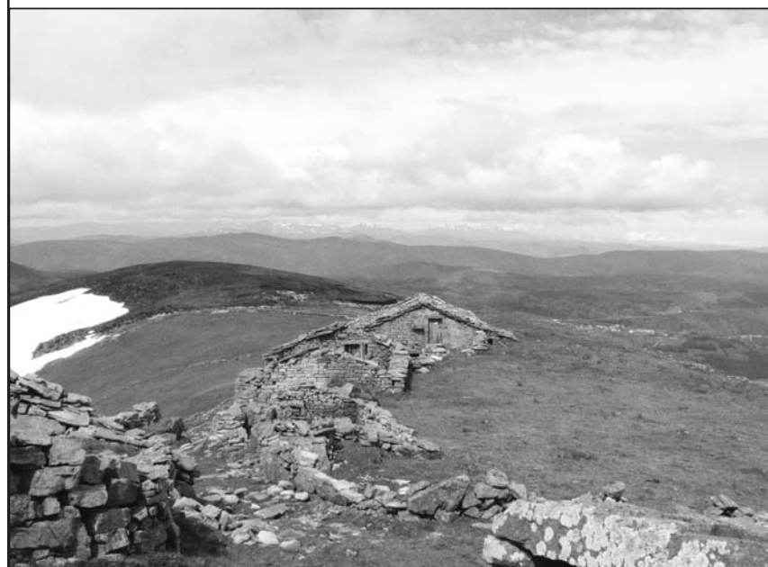
■ Cabañas de Marruya