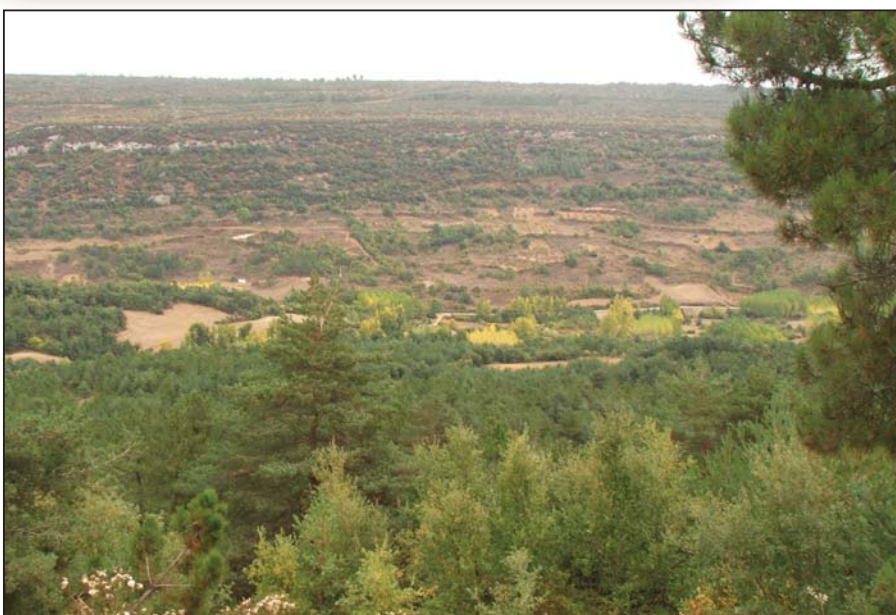
► Precioso paisaje de la subida

□ Después de tres horas y media de caminata llegamos a la cima, dode divisamos un bonito paisaje.