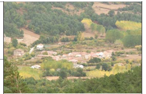
► Mesa de Oña

□ Iniciamos en la plaza del lavadero de oña, subimos por un camino que transcurre paralelo al muro del monasterio, siguiendo las marcas del P.R.