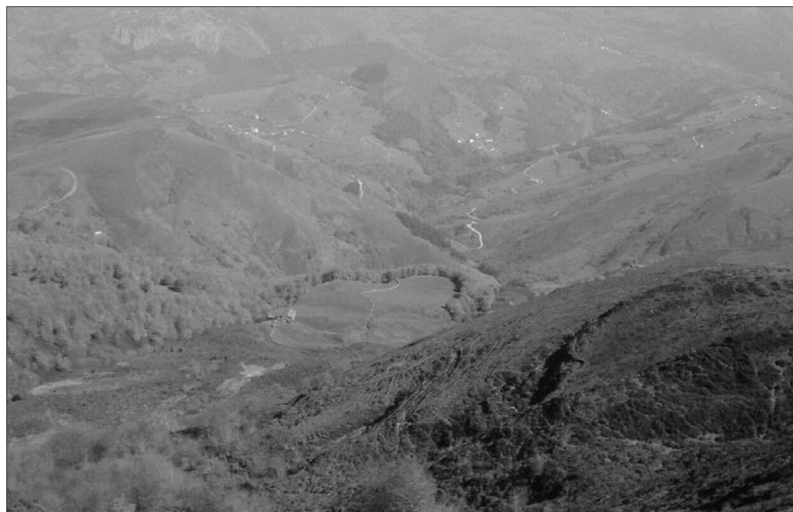
► Vistas del Valle de Soba