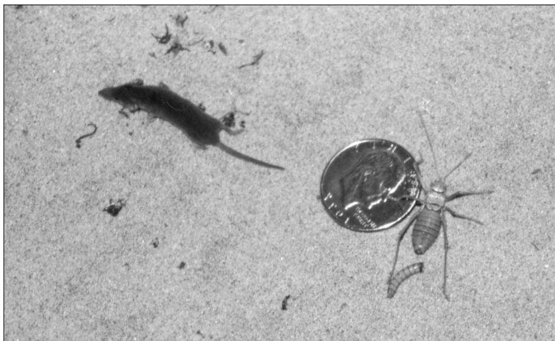
► Se puede comprobar el reducido tamaño de la musaraña en relación a un saltamontes y una moneda.

Pero en este artículo vamos a tratar de un grupo animal un tanto desconocido e ignorado por los humanos, "las musarañas y musgaños", que aunque se nombran a menudo, muchas personas creen que no existen. Las musarañas por supuesto que existen, son pequeños mamíferos de un tamaño menor que un ratón, que se alimentan sobre todo de orugas, lombrices de tierra y todo tipo de insectos que habitan los suelos. Su hocico