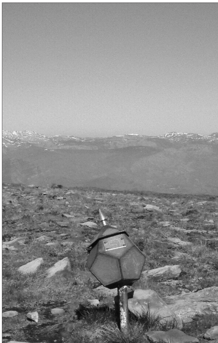
► Buzon y al fondo sierra del Hornijo y Ason