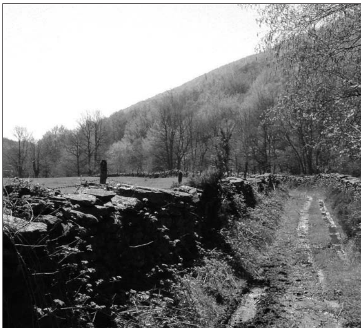
► Valle del Cerneja.

Es una preciosa ruta que los amantes del senderismo no se deben perder.