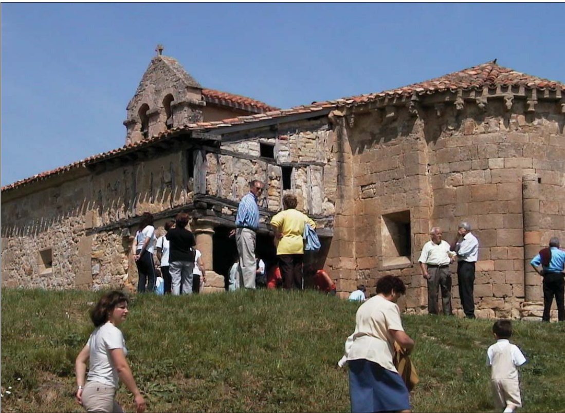
► Los romeros se van acercando a la parroquia de San Antolín para celebrar la fiesta

ceso de arco de medio punto, cobijado en un pórtico de madera y adobe y necesitado de una reparación urgente, el cual sirve de sostén a la antigua casa cural y de cofradía.