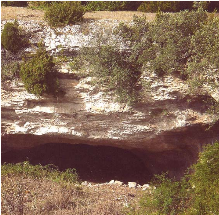
► Cueva cercana a la ermita

La ermita de Nuestra Señora de Pilas es un edificio poco atractivo, sin detalles cultos sobresalientes, un tanto mazacote y, si me apuran, mal hecho. De esto último dan fe los robustos contrafuertes añadidos que parecen sostener la delicada fábrica de su