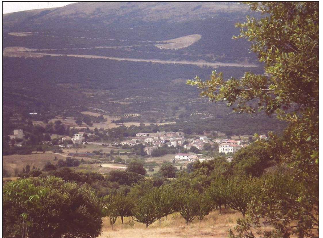
► Caserío de Quintana de Valdivielso visto desde la subida a Pilas

única nave. Casi todos sus vanos, cuatro, se abren al sur; uno más en la cabecera y otro en el lado opuesto, a los pies, proporcionan la escasa luz del interior. Alrededor del edificio se ha dispuesto una valla metálica, muy débil pero, al parecer, suficiente para cumplir el papel para el que fue colocada, que no es otro que impedir al numeroso ga-