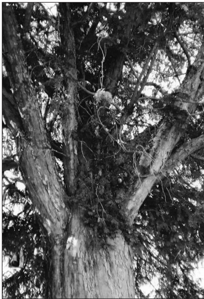
► Un joven tejo que ha cumplido 300 años