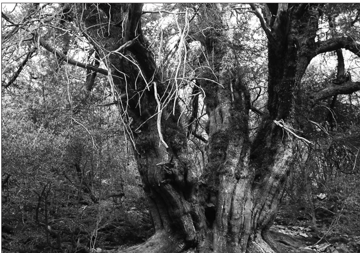
► Otro de los Tejos de Panizares