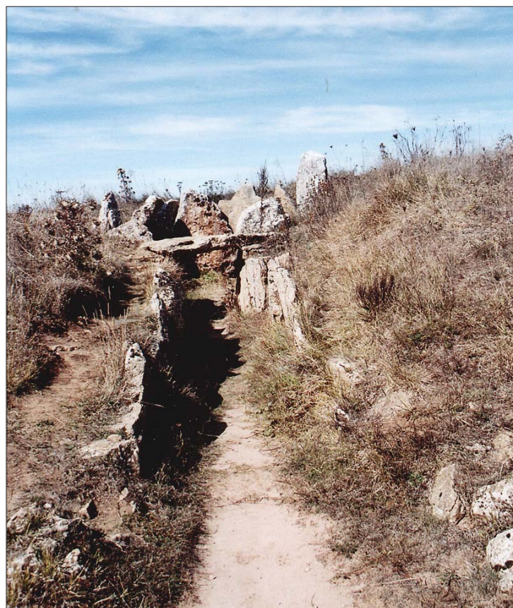
► Dolmen de La Cotorrita antes de ser restaurado

No cabe duda que visitar, sin prisas y con actitud receptiva de sus mensajes, estos megalíticos monumentos funerarios sirve de sedante emocional. En su presencia nuestra efímera existencia terrenal se nos presenta con toda su crudeza y su grandeza.