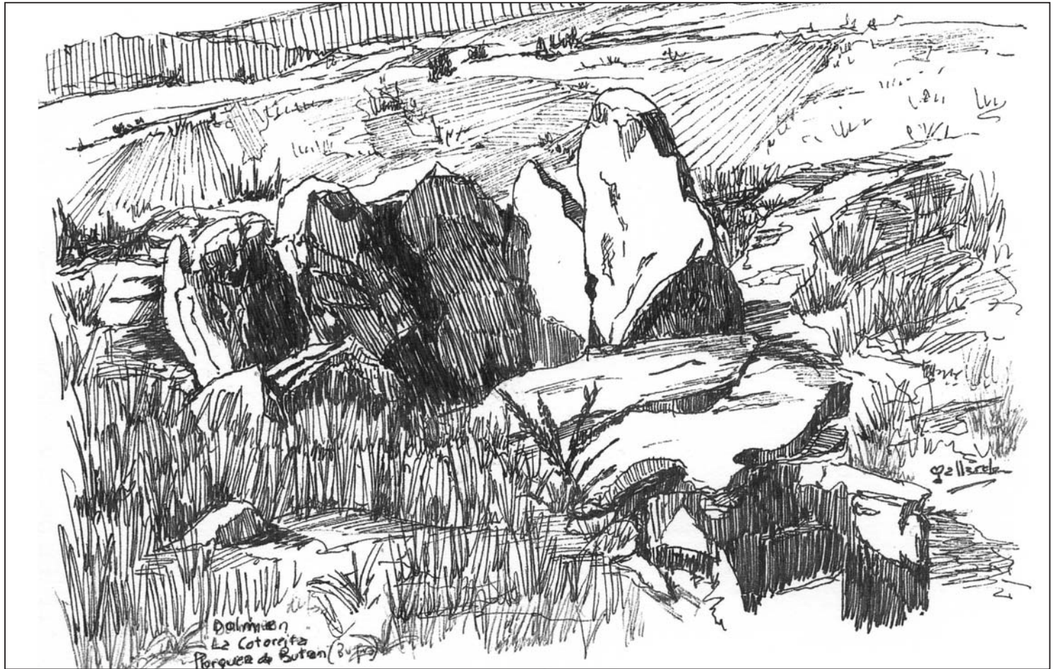
► Dolmen de La Cotorrita en Porquera de Butrón

Para visitar este lugar mágico desde Medina o Villarcayo habrá que llegar a Incinillas y, allí enlazar con la N-232 que, en Valdenoceda, enlaza a su vez con la C-629, que es la carretera que sube a la meseta por el puerto de La Mazorra. Una vez superado el puerto (los arreglos últimos lo han dejado más domesticado), apenas medio kilómetro más adelante, a la derecha, encontraremos el ramal que nos señala Dobro y que deberemos tomar. Cinco kilómetros andados, se llega a Porquera de Butrón, pero, doscientos metros antes de entrar en el nú-