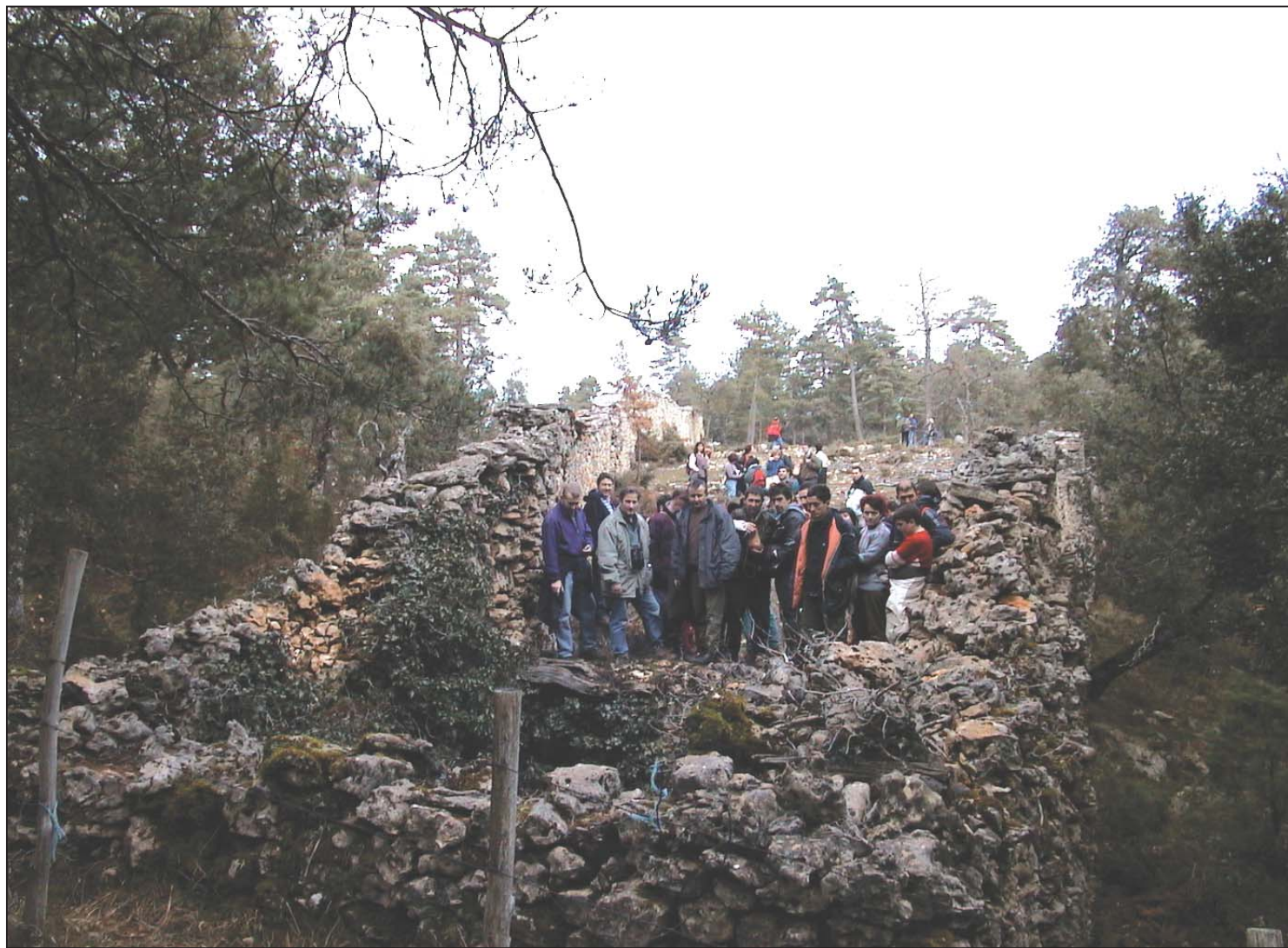
► Lobera de La Barrerilla, en Perex. Un grupo de excursionistas contemplan el foso