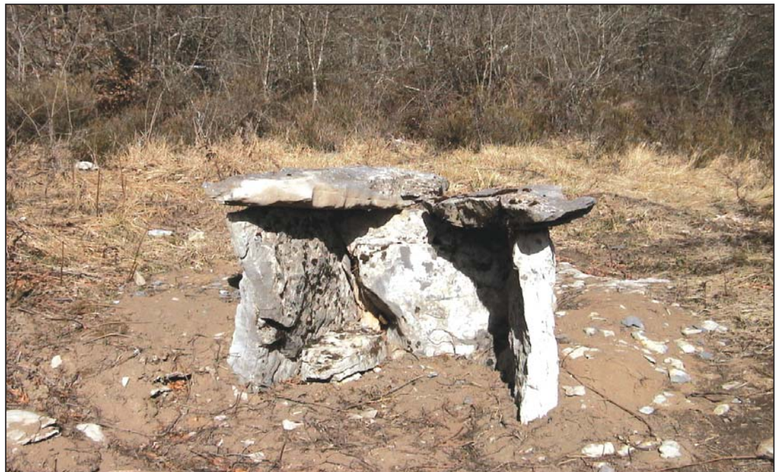
► Lobera de Santiago. Cabañuela que protege a los batidores