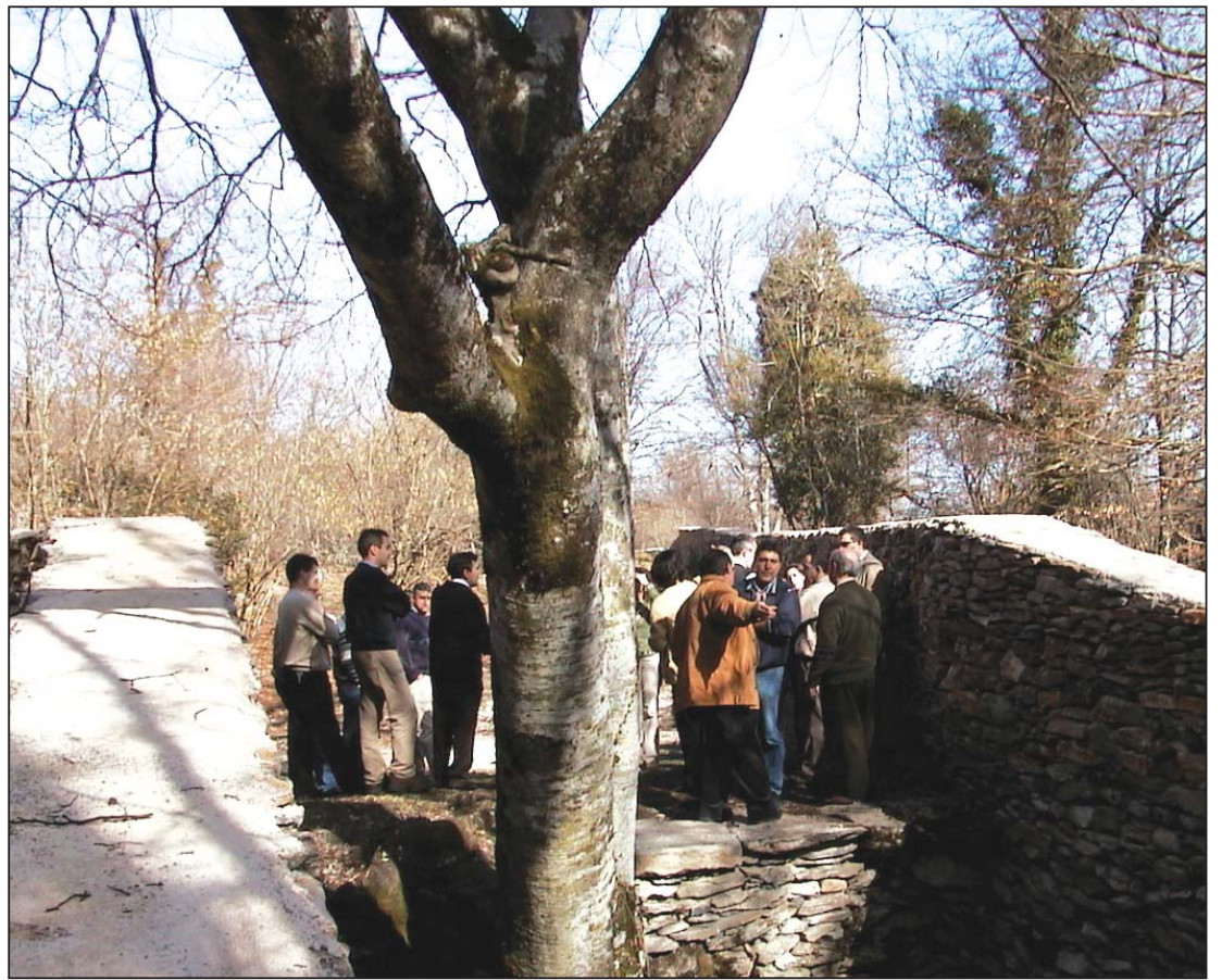
► La Lobera de Santiago, en Berberana, destaca por su buen estado de conservación

Por fin hablaremos de la Lobera del Alto del Caballo, en el municipio de Espinosa de Los Monteros. Su situación es casi inidentificable por las constantes agresiones a que ha sido sometida su estructura.