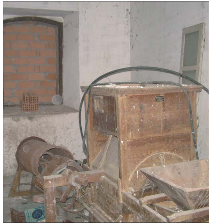
► Máquina limpiadora y separadora del trigo