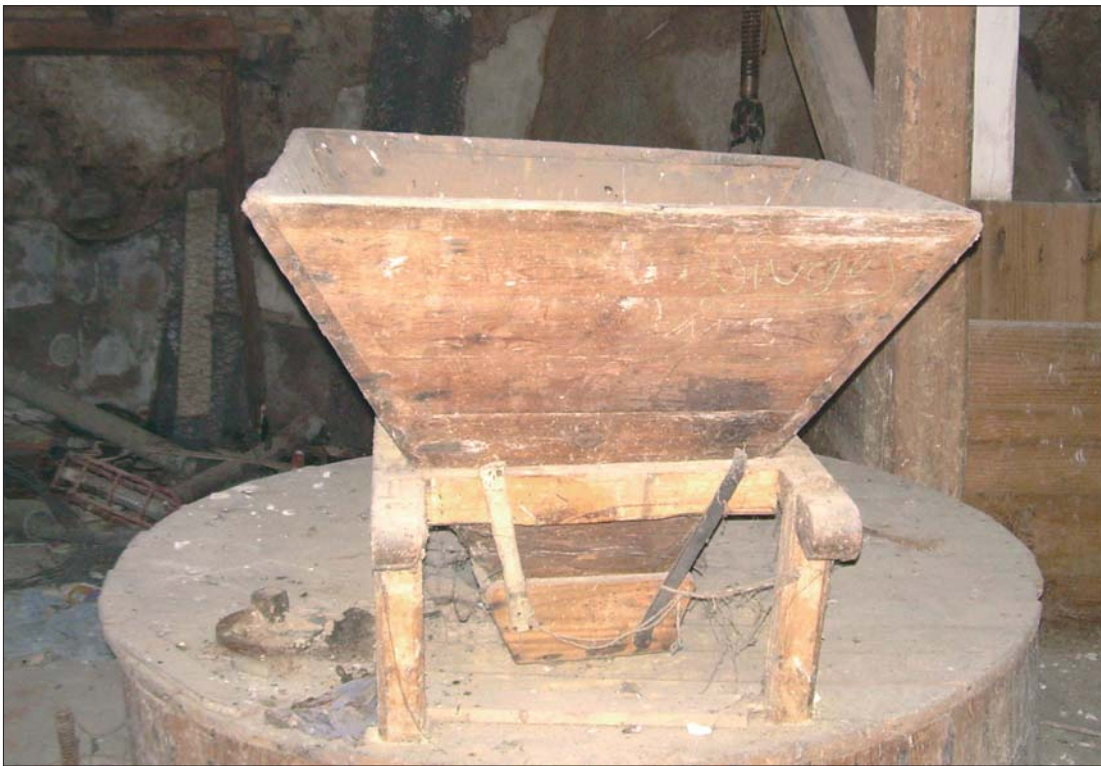
► Molino harinero