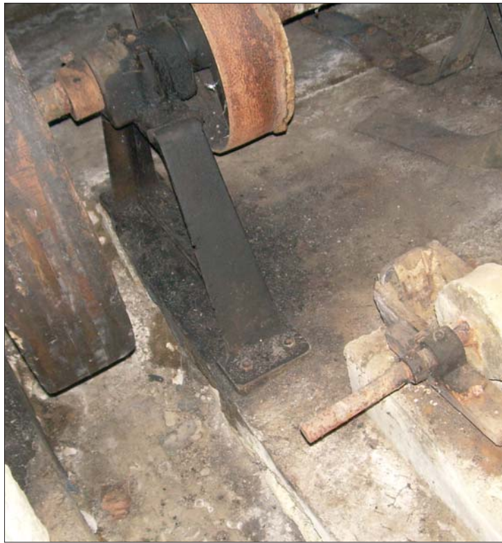
► Restos de la maquinaria de la fábrica de luz