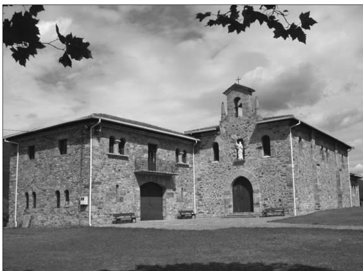
► Ermita de San Bartolomé en la actualidad

bao. En 1987 se hizo un injerto en el sifón de Rucabado para suministrar agua a El Berrón y en 1988 la localidad de Gijano pudo disponer de agua para el consumo de sus vecinos mediante un injerto realizado en el sifón de