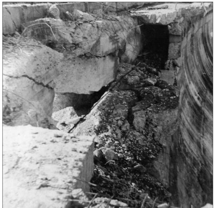
► Daños producidos por la explosión de la dinamita

Hasta 1987 el agua que se embalsaba en Ordunte se destinaba, íntegramente, a Bil-