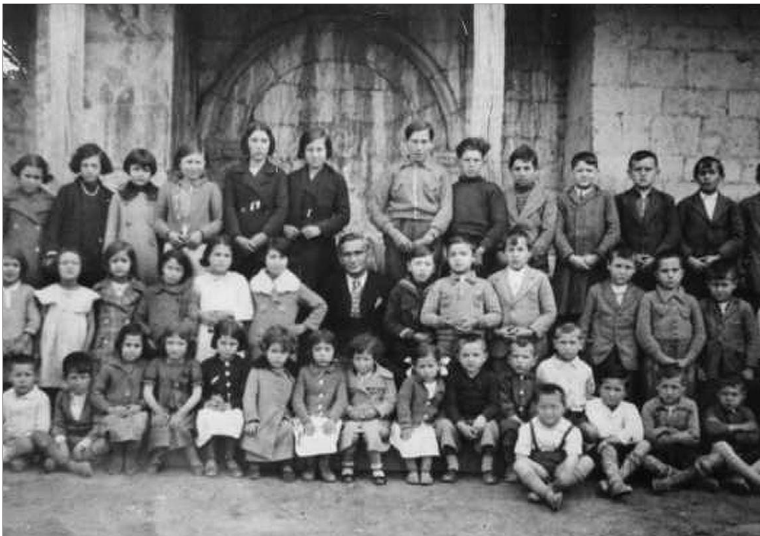
► Escuela de Arroyo el Valle de Valdivielso