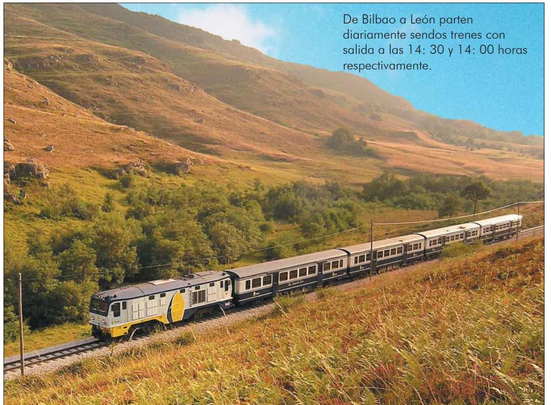
De Bilbao a León parten diariamente sendos trenes con salida a las 14: 30 y 14: 00 horas respectivamente.

Unos minutos más adelante llegamos a la estación de Cadagua (527 m). Cambiamos la vista a la derecha. Hemos ganado altura y vemos bien el Valle por la derecha. A escasos metros del pueblo nace el río del mismo nombre y lo hace con la potencia propia de los ríos Cantábricos. A lo lejos cerrando el Valle, los Monte de Ordunte, reciente-