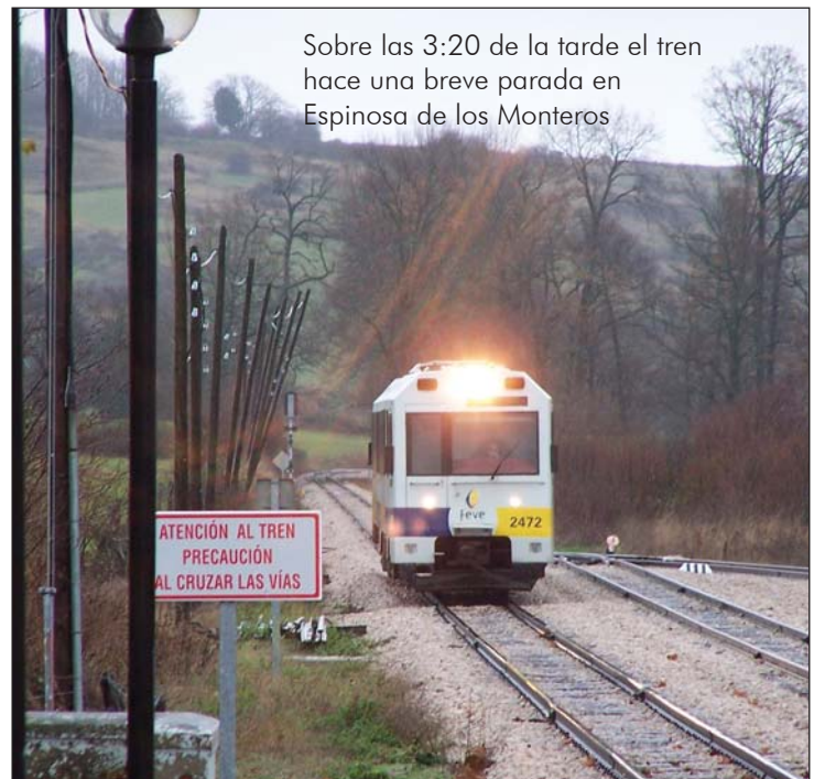
Sobre las 3:20 de la tarde el tren hace una breve parada en Espinosa de los Monteros

No tardamos en entrar en la Espinosa de los Monteros cuya Villa cuenta con un rico