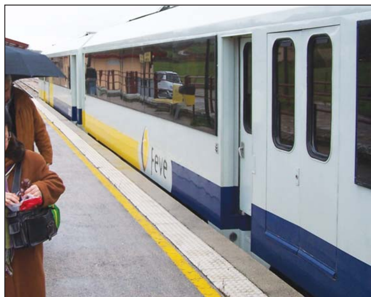
▶ En Arija tenemos el tiempo justo (1 hora y media) antes de coger el tren de vuelta para dar un paseo por el pueblo, tomar un tentempié o ver las casas de indianos próximas a la estación

Evocaremos la memoria de éste ferrocarril que con más de 100 años de antigüedad forma parte de la historia reciente de la comarca y a punto estuvo de desaparecer.