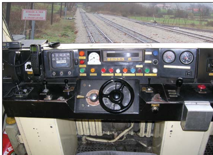
► Esta es la vista del maquinista durante el trayecto

patrimonio arquitectónico. En otro tiempo esta estación fue intensamente utilizada por montañeros procedentes del Gran Bilbao, que veían en estas montañas un buen lugar para su ocio y esparcimiento, y que tenían en el tren su medio de transporte favorito. Después de partir de la estación y cruzar el puente sobre el río Trueba, vemos por la derecha la Villa con su iglesia Santa Cecilia en el mismo centro.