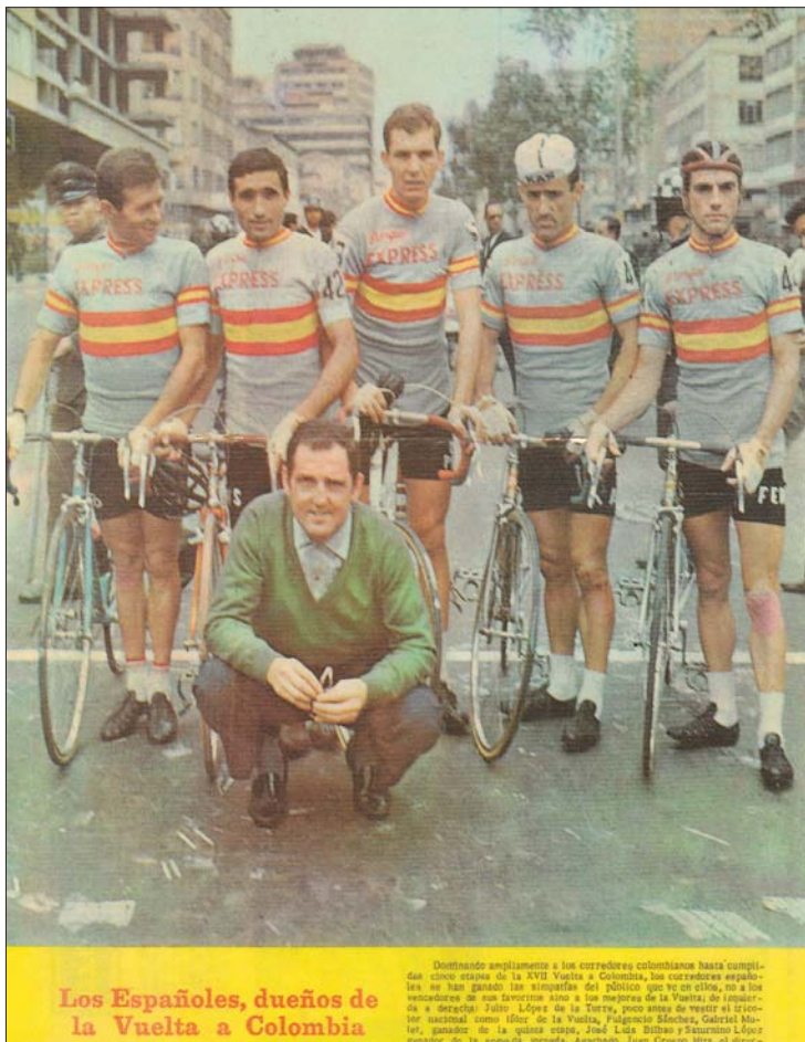
Los Españoles, dueños de la Vuelta a Colombia