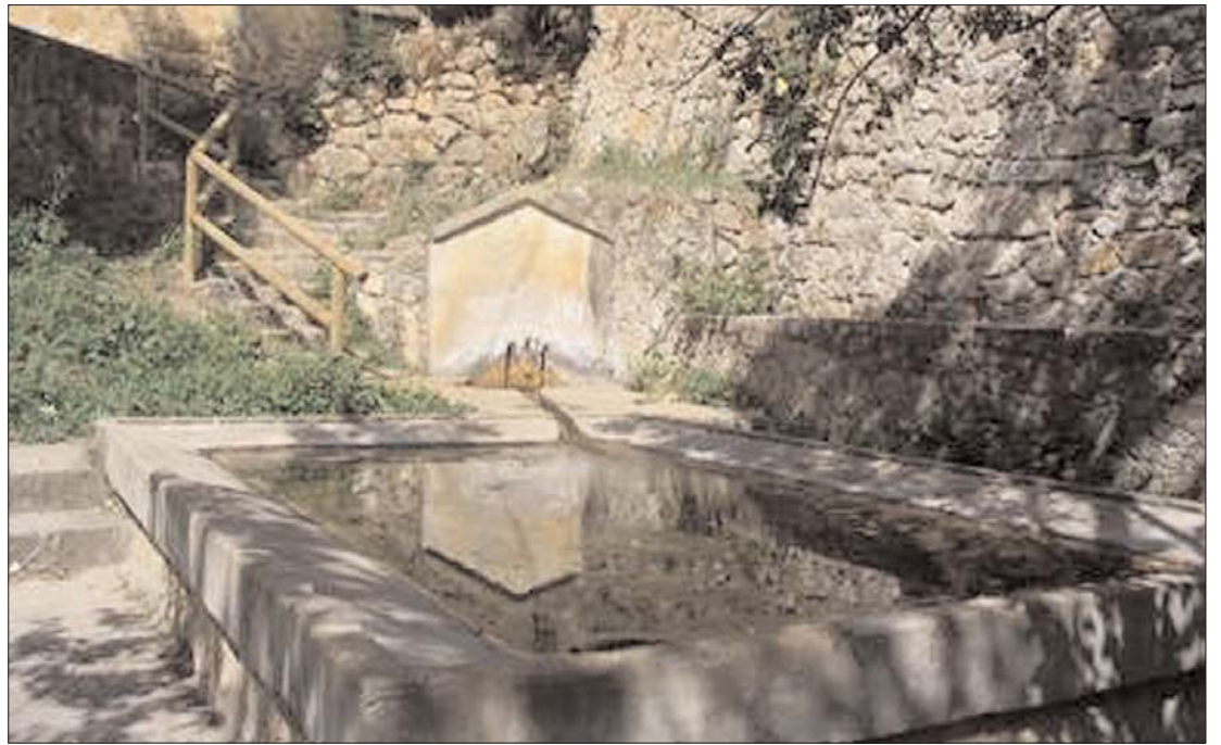
► Lavadero restaurado

27, tras haber quedado en el olvido cuando la fiesta se celebraba el día del Santo sea cual fuere el día de la semana,