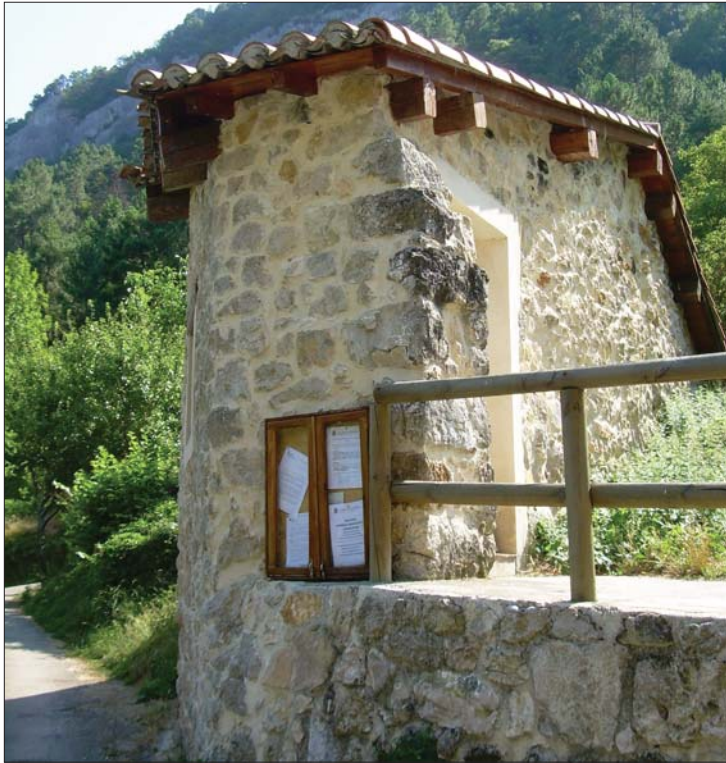
► Horno de cocer el pan

De esta manera, los juegos de bolos "el festejo más importante", dice un vecino, el tute, la brisca, la tuta, el mus, las peñas, las cuadrillas, la misa y la Comida Popular en la que "si hace bueno" se reúnen más de 600 comensales, son el nexo de unión de los vecinos de Trátales con los de la capital. De un tiempo a esta parte la romería se celebra el sábado más cercano al 25 de septiembre, en este caso el