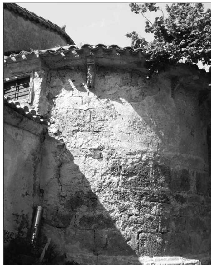
► Ábside románico de la parroquia

El envejecimiento de la población y las nuevas formas de vida han conseguido que Tartalés experimente una alta despoblación en beneficio de Trespaderne, capital del Municipio. No