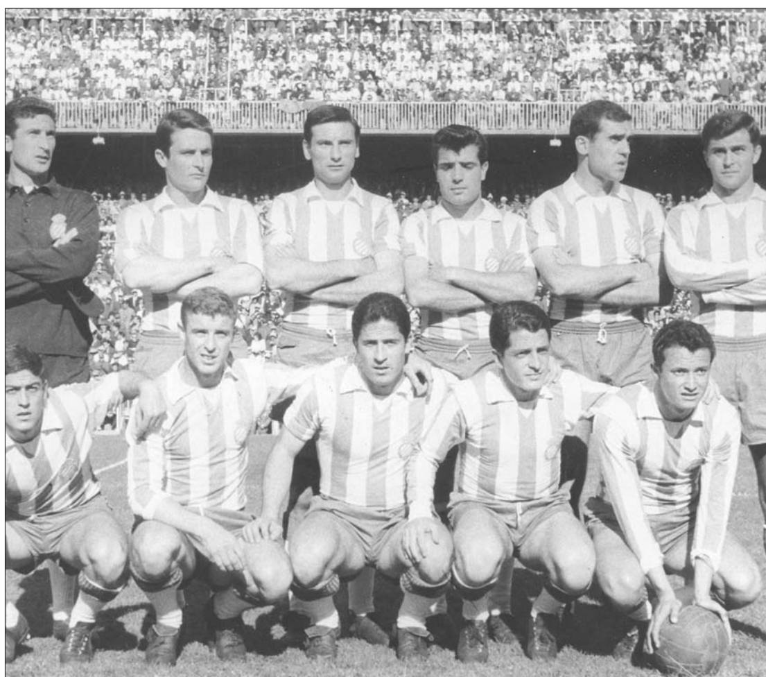
► Con el Español en el Bernabeu