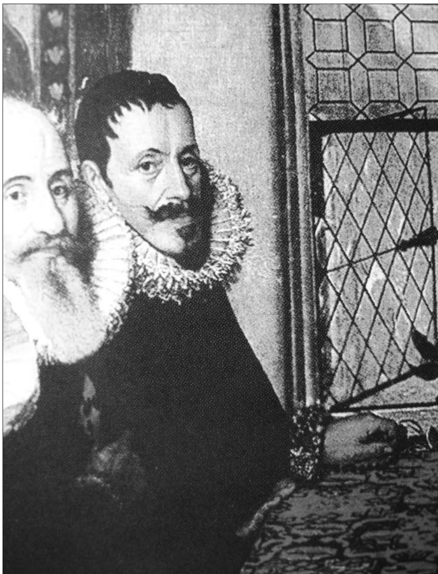
► Juan Fernández de Velasco en Londres (Cuadro de Pantoja)

berno bien no una, sino hasta tres veces.