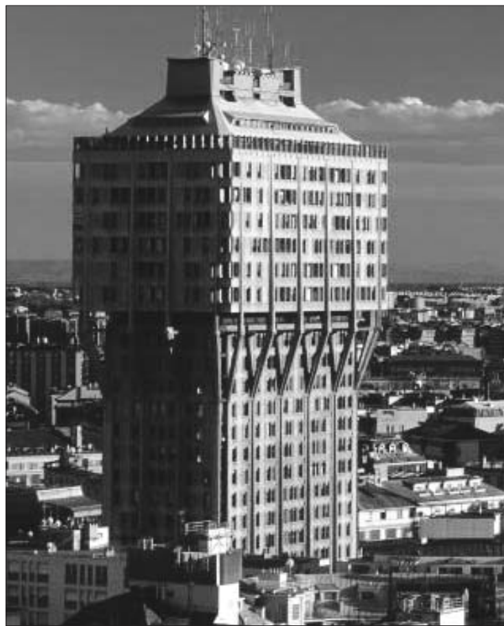
► La Torre Velasca (1956-1960), en Milán

Don Juan Fernández de Velasco recibió el gobierno milanés por Felipe II en 1592. Era como decir virrey en Nápoles o Sicilia, casi un jefe de estado. El cargo solía durar tres años. La dotación, ¡24.000 ducados!, en España sonaba redonda, pero era ridícula para el gasto. Un gobierno bastaba para consumir la fortuna personal de un buen gobernador, y don Juan go-