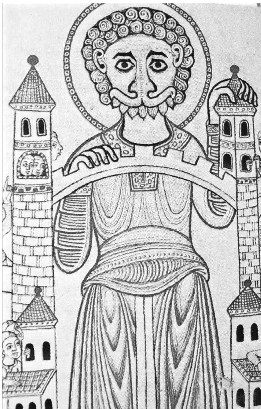
► San Cristobal Cinocefalo, en un manuscrito alemán del siglo XX

De ese modo el velasqueño 'Salone Margherita' fue escenario de la ópera milanesa hasta el 25 de febrero de 1776, cuando en una gala carnavalesca ardió en pompa. Y como además ya resultaba pequeño para tanta afición, la emperatriz María Teresa de Austria autorizó el derribo de la iglesia de la Escala para levantar el edificio profano que heredó el nombre. Así de aquel huevo