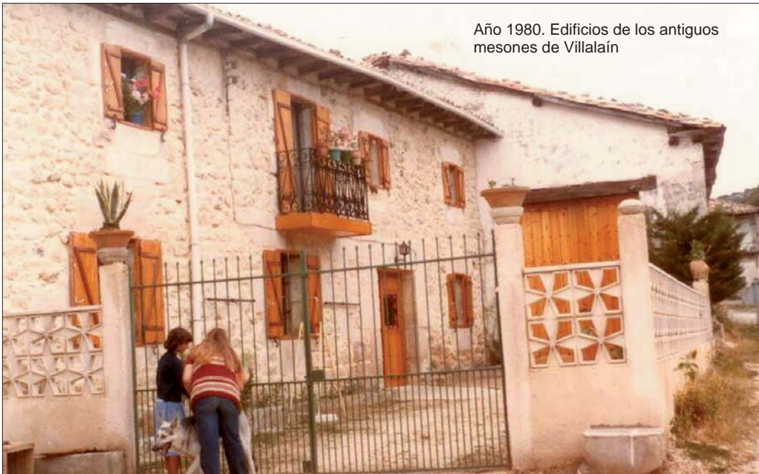
Año 1980. Edificios de los antiguos mesones de Villalaín