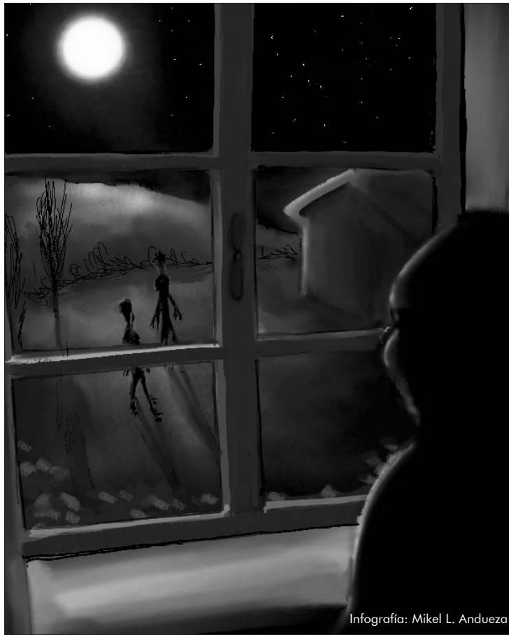
Infografía: Mikel L. Andueza

Por la mañana decidieron dar un paseo por el camino que había seguido la luz y descubrieron un gran círculo de hierba aplastada como si