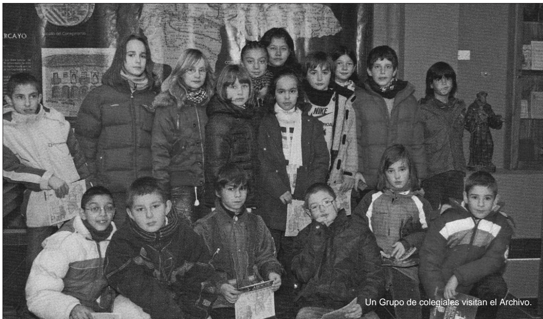
Un Grupo de colegiales visitan el Archivo.

Este fondo está constituido por unas 3.004 unidades documentales que son distribui-