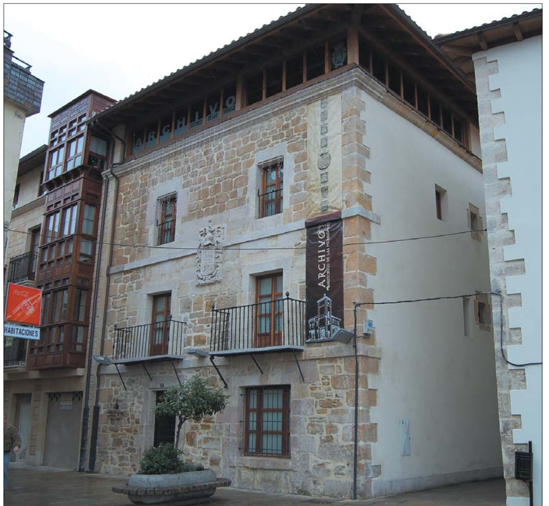
Edificio que alberga el Archivo Histórico de Las Merindades

El documento más antiguo que se alberga en el Archivo Histórico de las Merindades es uno del año de 1476. Se trata de un documento en el que se refleja el registro de actividades del Monasterio de Santa María de Rioseco que se completa dicha documentación hasta el año de 1722.