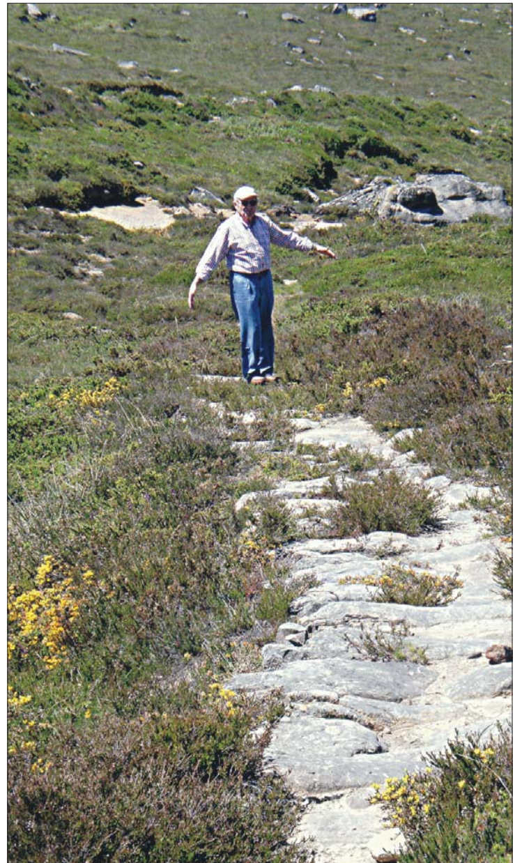
► La calzada ciclópea toma el descenso hacia el río Engaña.

Es hora de regresar por donde hemos venido o, si nos quedan ganas o hemos viajado en coche, seguir el camino sin asfaltar que baja por la orilla izquierda del río para llegar hasta la boca sur del túnel de La Engaña y al abandonado poblado de aquellos forzados hombres que, pagando muchas veces con su propia vida, lo horadaron. Inútil esfuerzo, por cierto, puesto que, al final, su sudor no valió para nada útil. Siguiendo esa carretera, desembocaremos, tras pasar por Rozas y San Martín de Porres, en la estación de ferrocarril y el poblado de Pedrosa de Valdeporres, entrañable rincón de gozosos recuerdos.