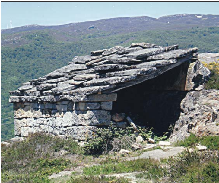
► Refugio junto a la calzada.

grandes bloques de piedra colocados muy cercanos entre sí, sin apenas resquicios en la unión de los mismos, y nivelados. Se trata, sin duda, de una vieja calzada