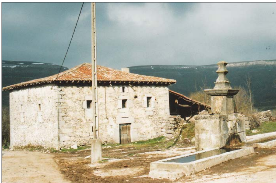
► Casco urbano de Relloso con el pilón de agua en primer término

Para alcanzar el túnel de La Complacera, que así se llama el agujero, deberemos dirigirnos a Quincoces de Yuso y coger la carreterilla que arranca en el lado sur del puente sobre el