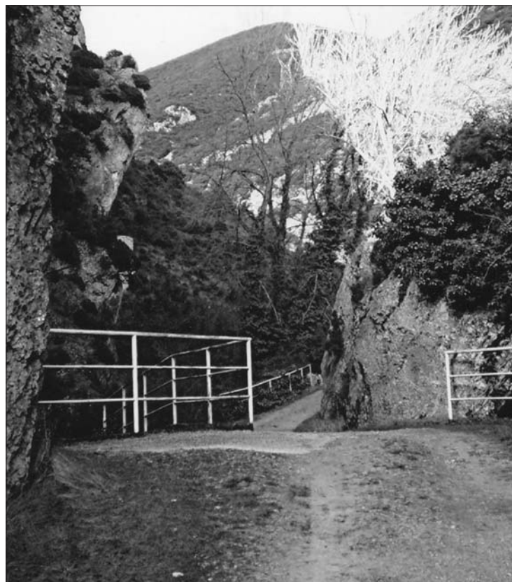
► El antiguo paso de Los Puentes se ha vuelto seguro y cómodo

Nuestra propuesta consiste en remontar la corriente del Purón desde Herrán y, a través del estrecho y espectacular desfiladero abierto por sus