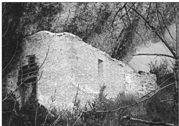
► Antiguo eremitorio de San Roque

Nada más pasar el puente reseñado, a nuestra izquierda, veremos la recuperada ermita de San Roque y San Felices, la cual el cronista vio totalmente arruinada hace tan solo unos pocos años y que, tras ser objeto de estudios arqueo-