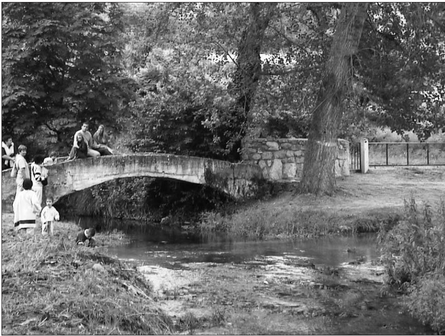
► Río Purón a su paso por Herrán

lógicos, está volviendo a su ser primitivo.