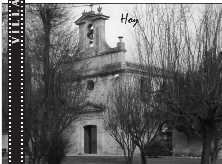
Ermita de San Roque