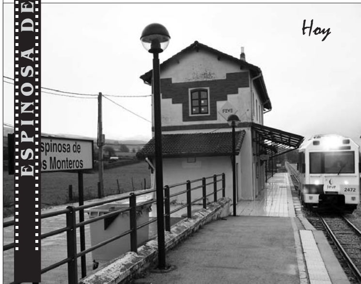
Estación de Tren