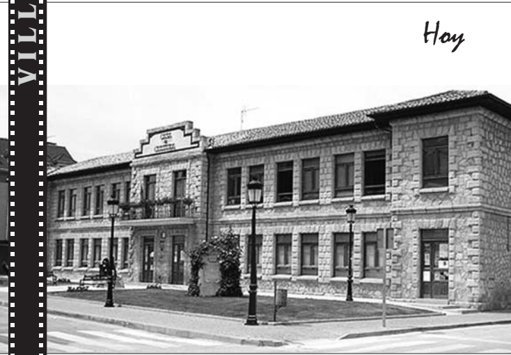
Casa de Cultura de Villarcayo, antiguas escuelas